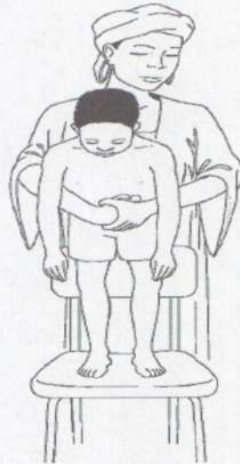
Прием Геймлиха для удаления инородного тела из дыхательных путей задыхающегося ребенка более старшего возраста.

2. После проведения этих манипуляций важно проверить проходимость дыхательных путей, для чего необходимо: