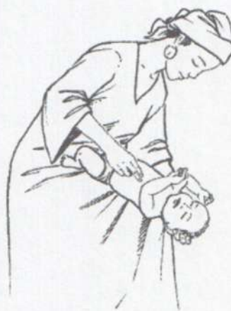
Толчкообразные надавливания на грудную клетку.