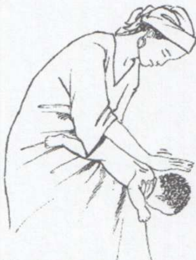
Похлопывание по спине.