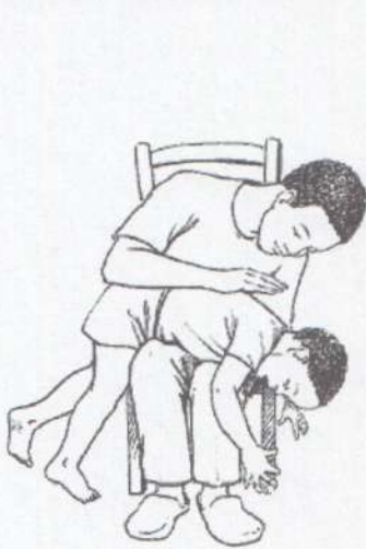
Удары по спине для удаления инородного тела из дыхательных путей задыхающегося ребенка.